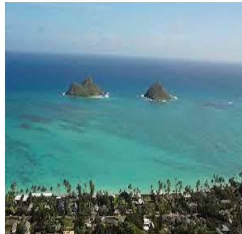
写真2 全米で一番綺麗と言われているラニカイビーチ散策