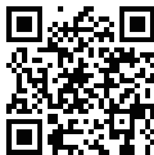
同窓会ウェブサイト QRコード